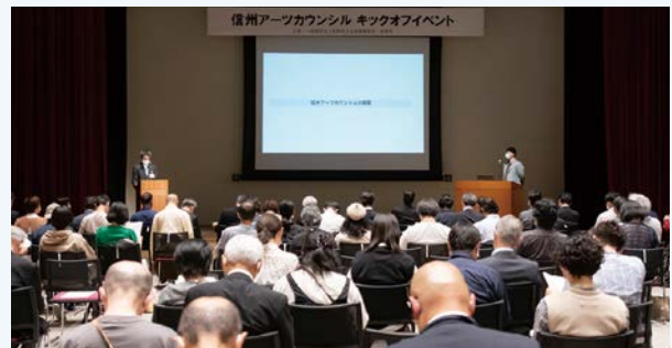
信州アーツカウンシル キックオフイベント

県、大学、民間支援団体、市町村、個人、さまざまな主体が連携し、長野県の多様な地域文化を支援する環境づくりを行います。