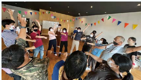
助成事業 JDS「つながるサーカスワークショップ」

文化芸術の場を開く「担い手」を広く捉え、表現者、参加者、企画・運営者、支援者など、さまざまな人たちを支援します。